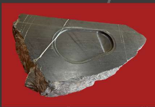
名硯 岩（石）王子石（広辞苑記載）