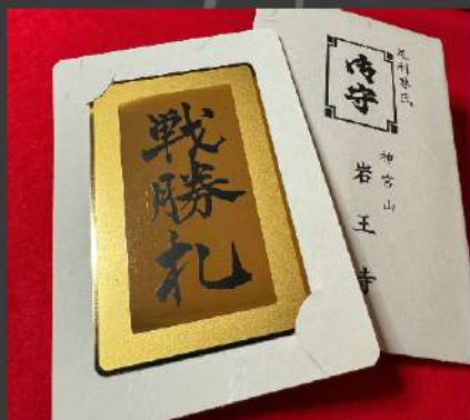
戦勝札（当日限定授与）

嵯峨天皇は岩王寺（石王子）石で出来た硯石を大変好まれ御愛用されておりました。「この硯は石の王子なるべし」として石王子（しゃくおうじ）と名付けられました。その後空也上人が石王子の由来から岩王寺（しゃくおうじ）として当山を建立されました。このお寺ゆかりの嵯峨天皇と真言宗開祖である弘法大師は、ともに日本三筆としてその名を知られており、日本三筆のうち2名と由縁のある珍しい寺院です。