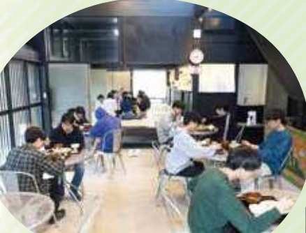
1階 宿泊者用食事エリア

土間席と畳席があり、ゆったりと食事をしていただけます。ご予約は10人以上で承ります。2週間前までにお願いします。