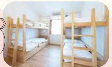
宿泊室 洋室 京都府内産の木材を使った2段ベッドが2台