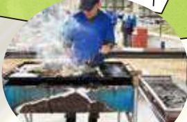
バーベキューサイト

敷地内 24台 空山の里 10台 台数が多いご利用の場合は、あらかじめご相談ください。